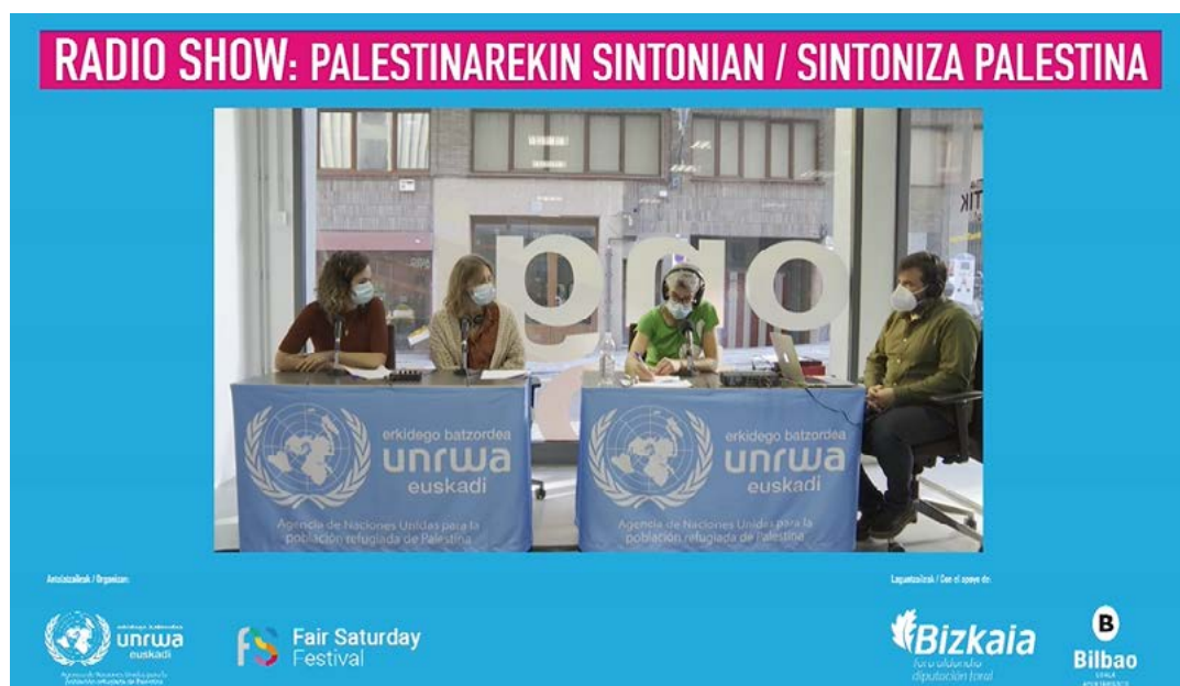
Fair Saturday. UNRWA Euskadi

invisible para crear podcasts feministas con mujeres y estudiantes de Bilbao y Bizkaia. La grabación está disponible aquí: https://www.pscp.tv/w/1RDxIPjXyXRxL