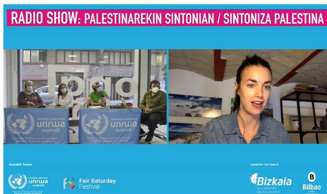
Fair Saturday. UNRWA Euskadi