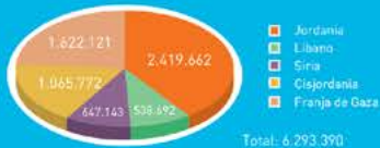
Población por área